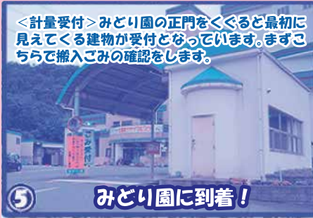
<計量受付>みどり園の正門をくくると最初に見えてくる建物が受付となっています。まずこちらで搬入ごみの確認をします。