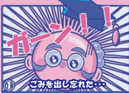
① ごみを出し忘れた...