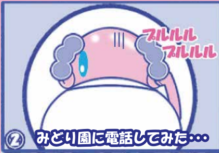
② みどり園に電話してみた...

はい、みどり園です。 あのごみを出し忘れたのですが... 直接持って行くことは可能ですが? はい大丈夫ですよ。 受付時間は平日午前9時~12時まで 午後は1時~4時までで持ってきてください。 ちなみに料金は... はい、搬入料金は10kg当たり80円となっています。 出し忘れの場合、指定袋2袋までは無料です。 はい、ありがとうございます。