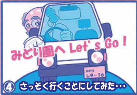
④ さっそく行くことにしてみた...

はい、みどり園です。 あのごみを出し忘れたのですが... 直接持って行くことは可能ですが? はい大丈夫ですよ。 受付時間は平日午前9時~12時まで 午後は1時~4時までで持ってきてください。 ちなみに料金は... はい、搬入料金は10kg当たり80円となっています。 出し忘れの場合、指定袋2袋までは無料です。 はい、ありがとうございます。