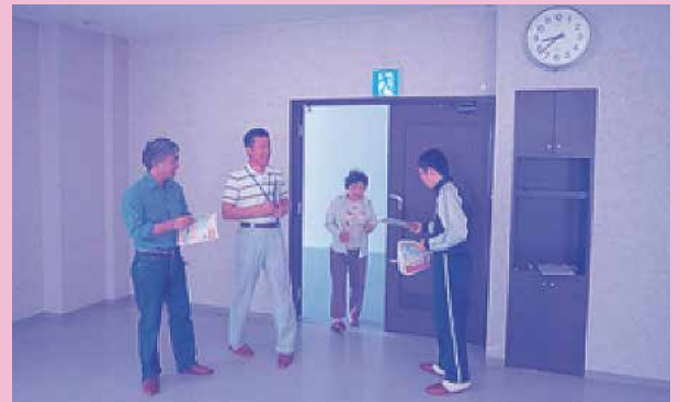
ステーションパトロールのサポーターとして参加しました。 たくさんの人の前でもがんばれました。