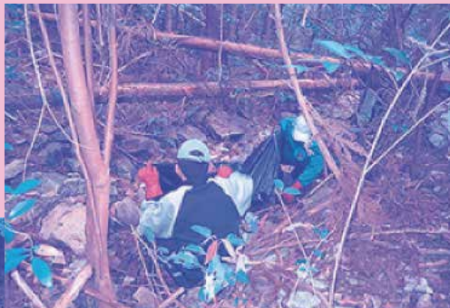
↑不法投棄のごみの多さにもビックリ! 短時間の作業でこんなにたくさん。→