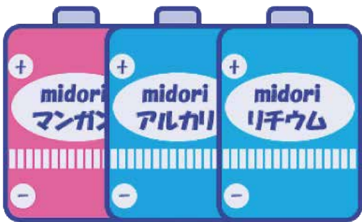
マンガン電池・アルカリ電池・リチウム電池