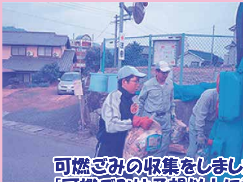
可燃ごみの収集をしました。 「可燃ごみは予想以上に重かったです。」

「地域の中学生が学校ではできない社会体験をする」ことを目的で推進されている学習なので、みどり園では安全を確保しながら、日常の業務を体験してもらいました。