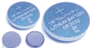
・アルカリボタン電池・酸化銀電池 ・空気(亜鉛)電池