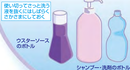
使い切ってさっとはらう液を抜くにはしばらくさかさまにしておく