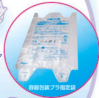
容器包装プラ指定袋