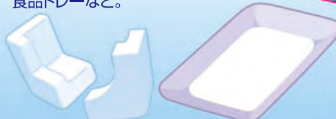
緩衝材(発泡スチロール等)