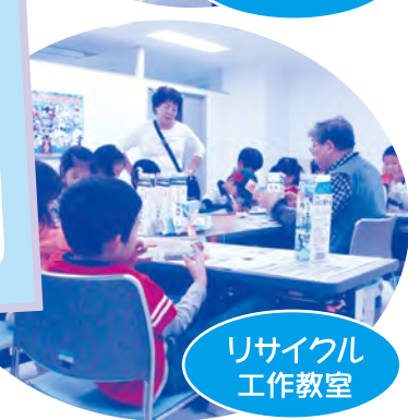
リサイクル 工作教室