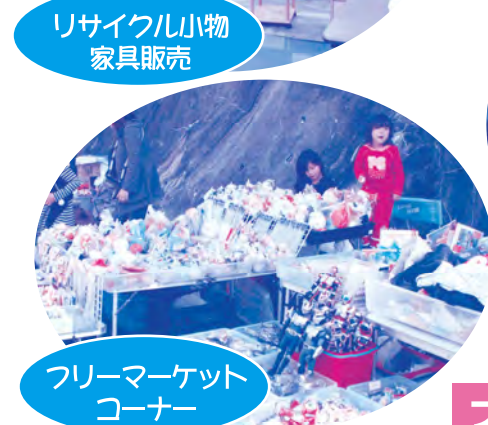
フリーマーケット コーナー