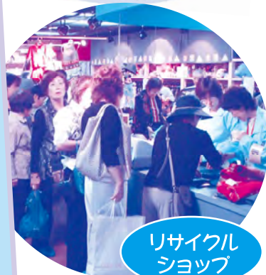
リサイクル ショップ