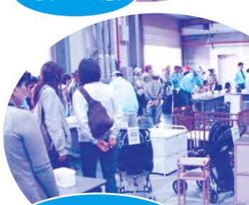
リサイクル小物 家具販売