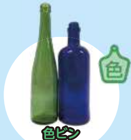
色ビン 果実酒など