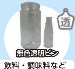
無色透明ビン 飲料・調味料など