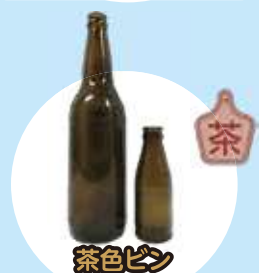
茶色ビン ビール・ドリンク剤など