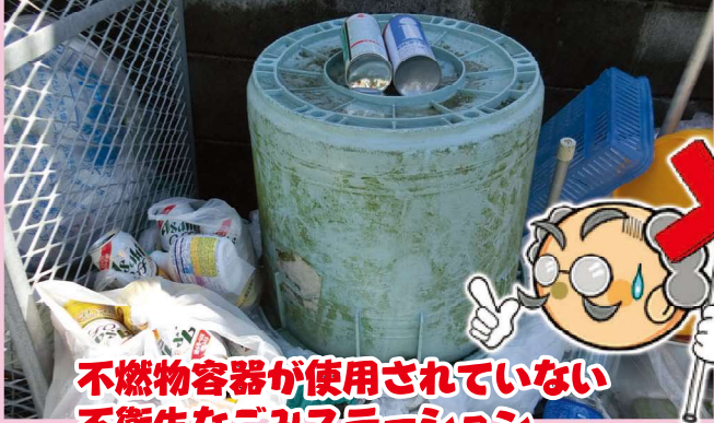
不燃物容器が使用されていない 不衛生なごみステーション

不燃物(金属類・ビン類・その他の不燃物類)を持ち出す時は不燃物容器をご使用ください。