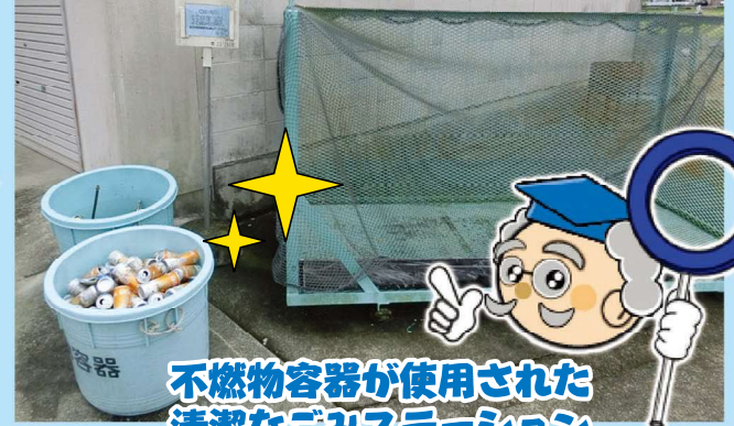
不燃物容器が使用された 清潔なごみステーション