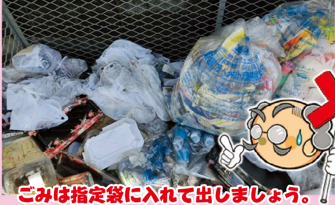
ごみは指定袋に入れて出しましょう。