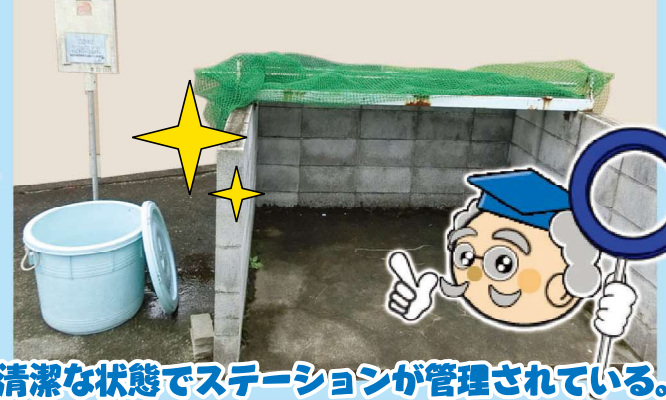
清潔な状態でステーションが管理されている。

ごみステーションの管理でお困り事がありましたら、みどり園までお問い合わせください。